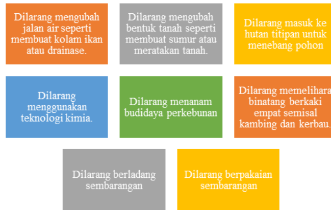
Gambar 2. Larangan dan Adat Badui, Pikukuh Badui

Demikian pula, mereka masih menerapkan Pikukuh Badui yang terdapat dalam gambar 2 sebagai berikut. Intinya, Pikukuh Badui adalah sistem nilai dan norma yang kuat yang mendukung kehidupan masyarakat Badui. Aturan-aturannya bertujuan untuk menjaga budaya, alam, dan hubungan sosial masyarakat Badui.