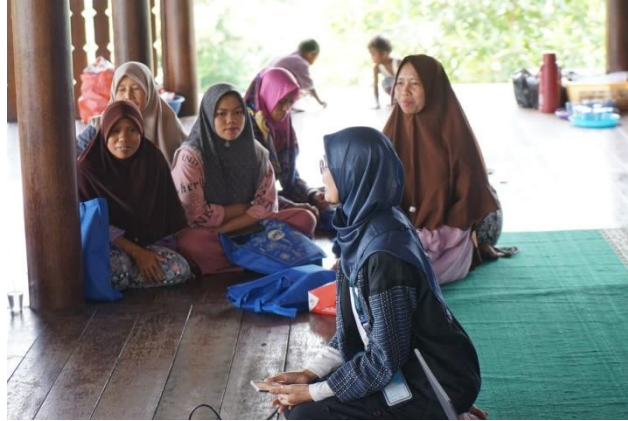
Gambar 3. Pemaparan Materi dan Diskusi dengan warga Desa Landeuh

yang ditentukan adalah semua masyarakat. Isi kegiatan antara lain memberikan sampah yang ada di lingkungan. Lalu membersihkan sampah di halaman masing-masing, dan memilah sampah organik dan nonorganik serta menempatkan dalam wadah tempat sampah yang berbeda, membuat saluran pembuangan. Langkah yang dijalankan dikonsulkan dan dikoordinasikan ke RT/RW.