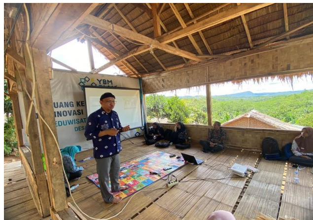
Gambar 4. Pemaparan Materi dan Diskusi dengan warga Desa Landeuh

Kelompok 2 menghasilkan program Pemilahan Sampah. Sasaran yang ditentukan adalah Ibu-ibu, bapak-bapak serta anak-anak semua warga masyarakat. Isi kegiatan antara lain memilah sampah organik dan nonorganik, mendaur ulang sampah, sampah organik menjadi kompos, sampah nonorganik menjadi berbagai kerajinan diantaranya membuat tas dari sampah plastik, membuat bunga dari sampah plastik dan lainnya. Langkah yang dijalankan telah adalah dikonsultasikan dan dikoordinasikan ke RT/RW dari pendamping desa.