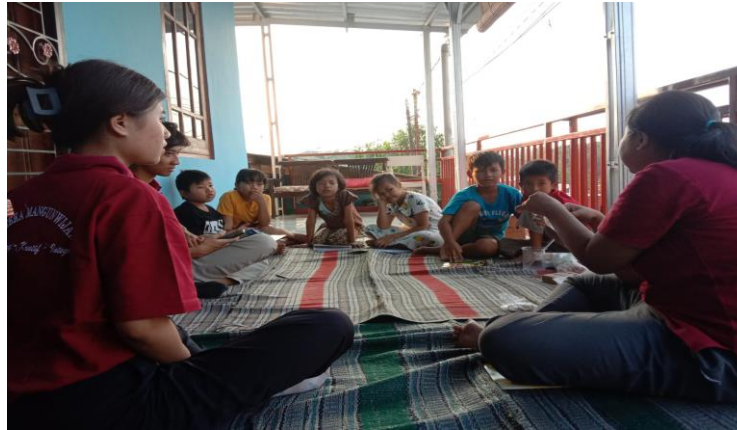
Gambar 3. Penjelasan materi dan fungsi bahan

Sumber: Dokumentasi Tim Pengabdian – Kegiatan Pengabdian kepada Masyarakat (2020)