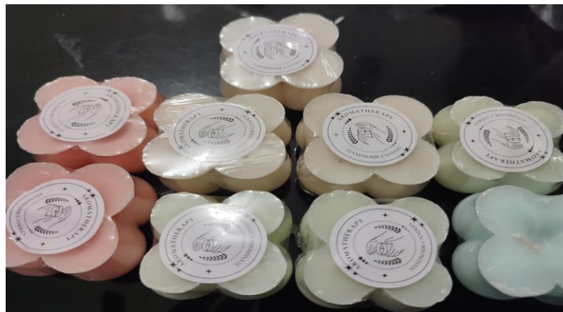
Gambar 5. Produk Lilin Aromaterapi

Setelah produk lilin mengeras sempurna, tahap selanjutnya adalah packing . Tahap packing dilakukan dengan melapisi lilin aromaterapi dengan plastic wrap dan menempelkan stiker pada produk lilin agar menarik bagi konsumen. Tahap ini dilakukan secara mandiri oleh adik-adik dampingan. Anak-anak dampingan melakukan kegiatan packing dan penempelan stiker dengan sangat antusias dan hati-hati. Hasil lilin aromaterapi yang telah di packing dan dibubuhi stiker seperti ditunjukkan pada Gambar 5 berikut.