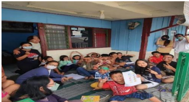
Gambar 1. Suasana Pendampingan PS. Garam

Aksi nyata yang dilakukan oleh para pendamping PS GARAM adalah secara khusus memberi perhatian kepada anak-anak yang kurang mampu baik dari segi finansial maupun intelektual. Kepedulian PS GARAM ini diwujudkan dalam pendampingan belajar informal yang dilakukan seminggu sekali selama kurang lebih dua jam setiap kali pertemuan. Suasana kegiatan pendampingan anak-anak di Deliksari seperti ditunjukkan pada Gambar 1 berikut.