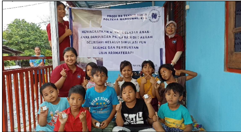
Gambar 6. Foto Bersama Setelah Kegiatan