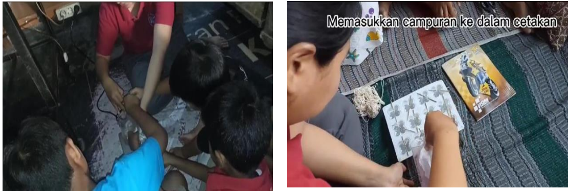
Gambar 4. Proses Pembuatan dan Pencetakan Lilin Aromaterapi