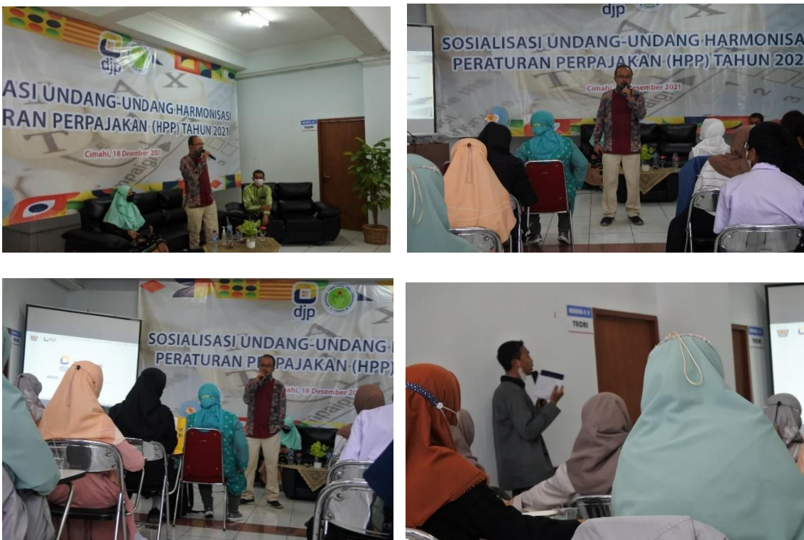
Foto 3. Pembukaan acara literasi dan sosialisasi UU HPP