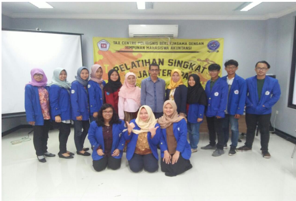
Gambar 8. Foto Bersama Dengan Peserta