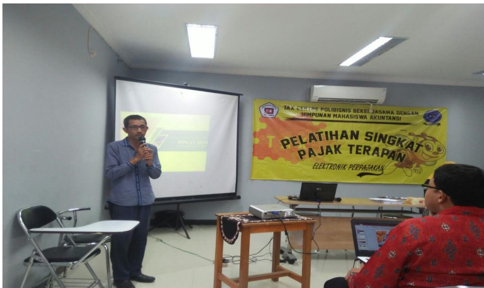
Gambar 4. Pemberian Materi Aplikasi e – SPT PPh