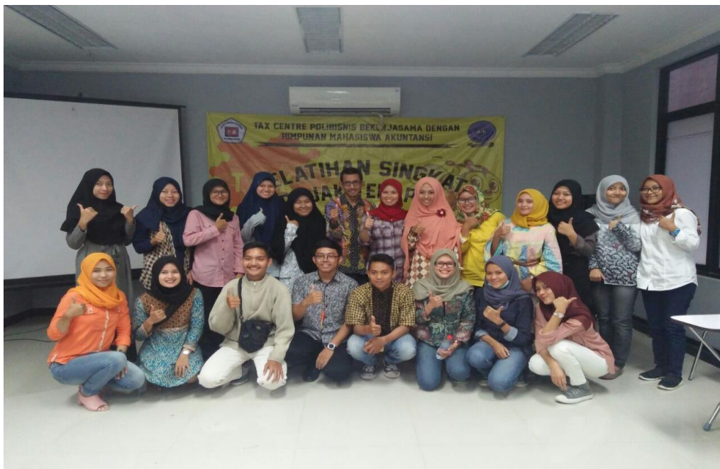
Gambar 5. Foto Bersama Dengan Tim