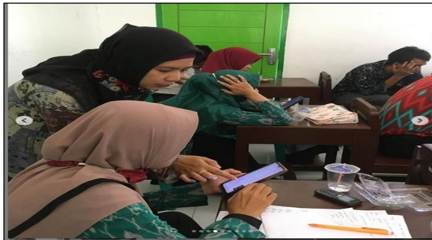
Gambar 2. Pemaparan Konsep CT