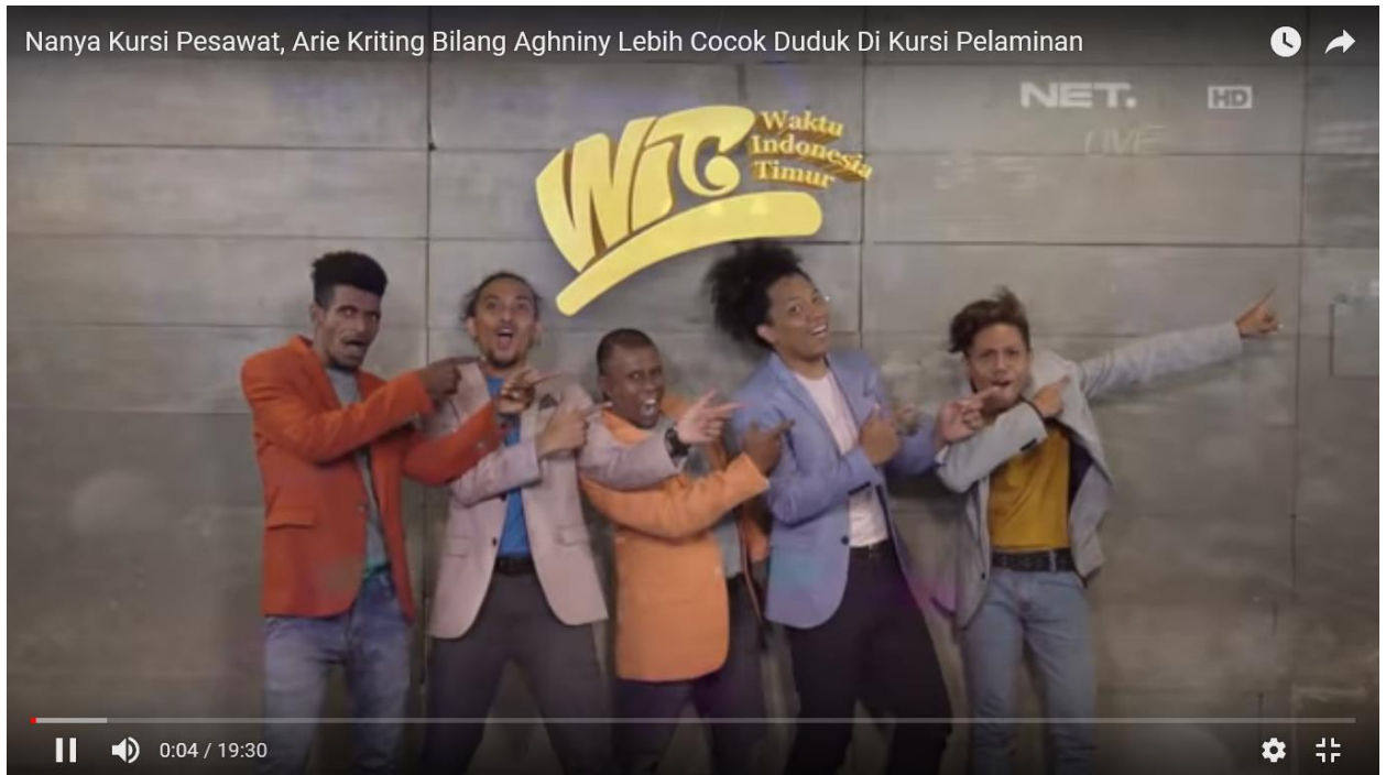
Gambar Gestur Tagline