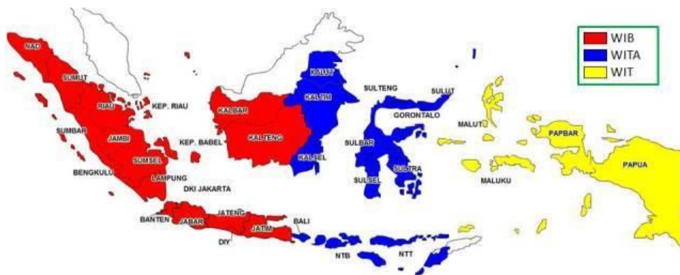
Gambar 1.1 Pembagian Waktu Indonesia

Dalam keragamannya Indonesia juga memiliki potensi untuk menghasilkan rating bagi para pekerja televisi. Terutama mengenai disparitas Indonesia. Kontur Indonesia yang begitu rumit sebagai negara kepulauan menyebabkan Indonesia terbagi menjadi Indonesia Timur dan Barat. Jika dilihat dari pembagian waktu, Indonesia terbagi menjadi Wilayah Indonesia Barat, Wilayah Indonesia Tengah, dan Wilayah Indonesia Timur. Hal ini seperti yang ditunjukkan dalam gambar berikut ini: