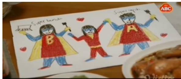
Gambar 1 Super Bunda dalam Iklan Super Bunda dan Suami Sejati