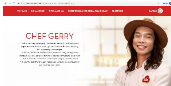
Gambar 4 Homepage Kenali Chef