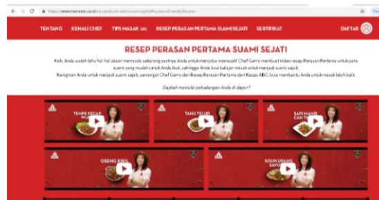
Gambar 6 Homepage Video Resep Perasan Pertama Suami Sejati