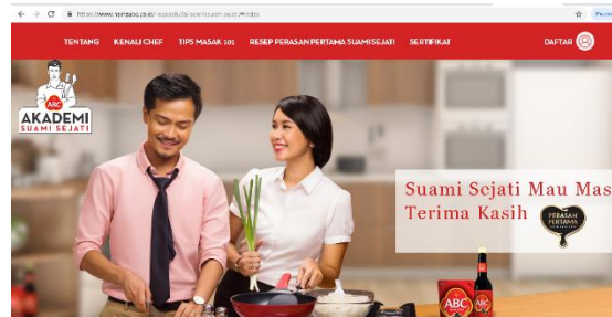
Gambar 2 Website Suami Sejati Mau Masak