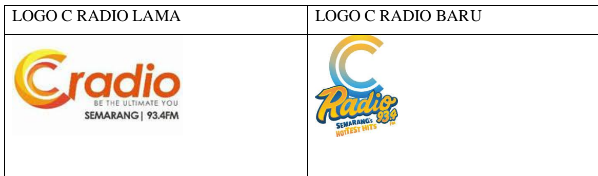
Gambar 1. Perubahan Logo C Radio

Selain itu dikatakan pula oleh Doug Harris dalam Geller (2007:248-252) bahwa Logo adalah bagian dari membangun koneksi emosional dengan pendengar. Hal ini menandakan bahwa perubahan logo yang dilakukan oleh C Radio merupakan langkah yang tepat, berikut perubahan yang terjadi di logo C Radio.