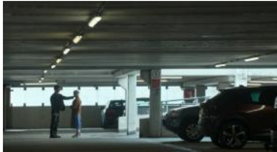
Gambar 4. Adegan Tobias memegang wajah Almut (Adegan 4)